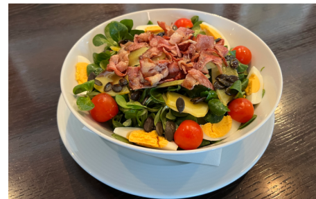
Vogersalat mit Speck, Ei, Kartoffeln