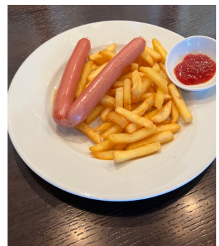
Frankfurter mit Pommes